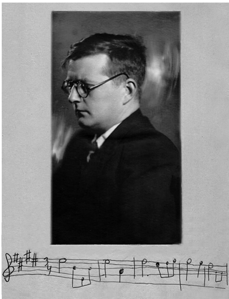
Фотография Д. Д. Шостаковича с дарственной надписью М. С. Вайнбергу: «Дорогому Моисею Самуиловичу Вайнбергу. 30/VIII 47. Шостакович».